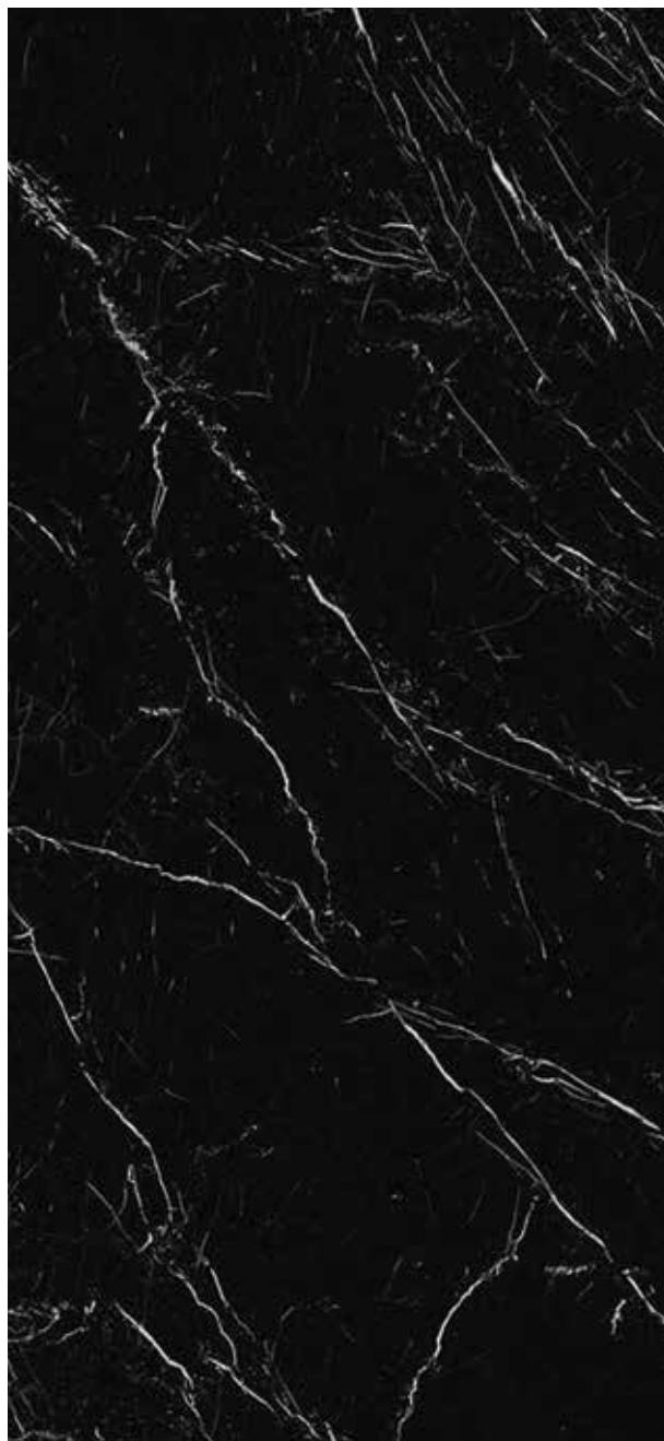
NERO MARQUINA POLER