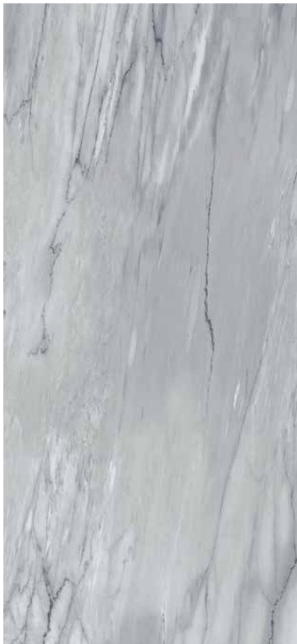
BARDIGLIO GRIGIO POLER