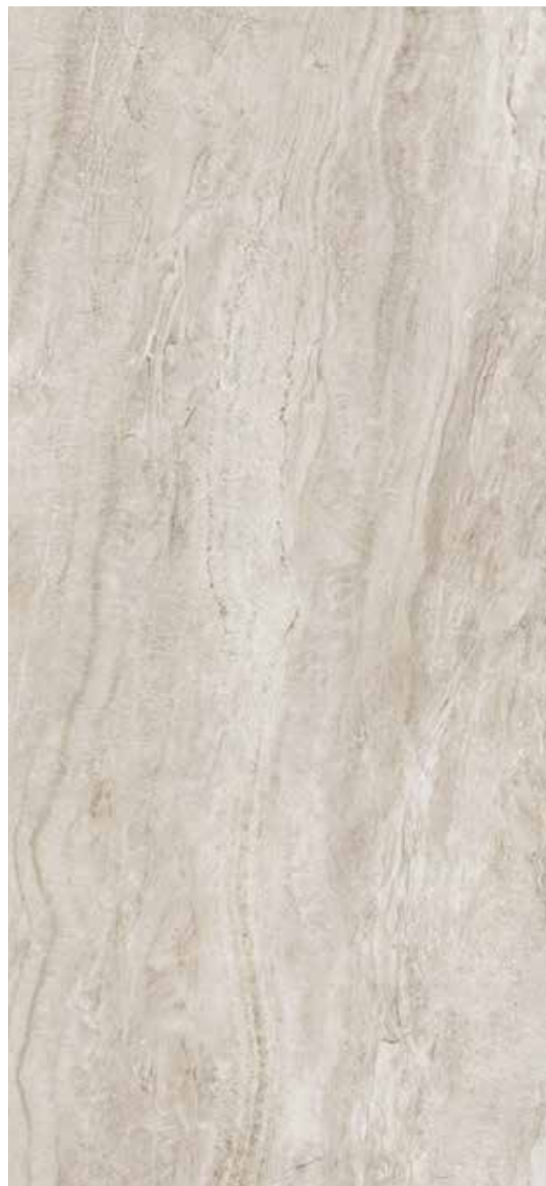
BRECCIA BEIGE POLER