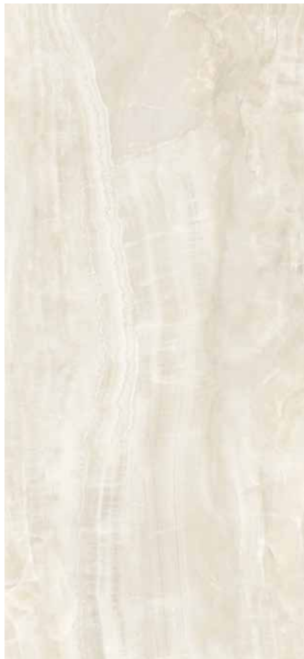
ONICE AVORIO POLER