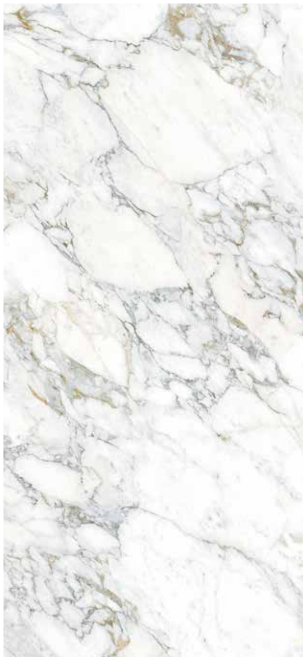
ARABESCATO ORO POLER