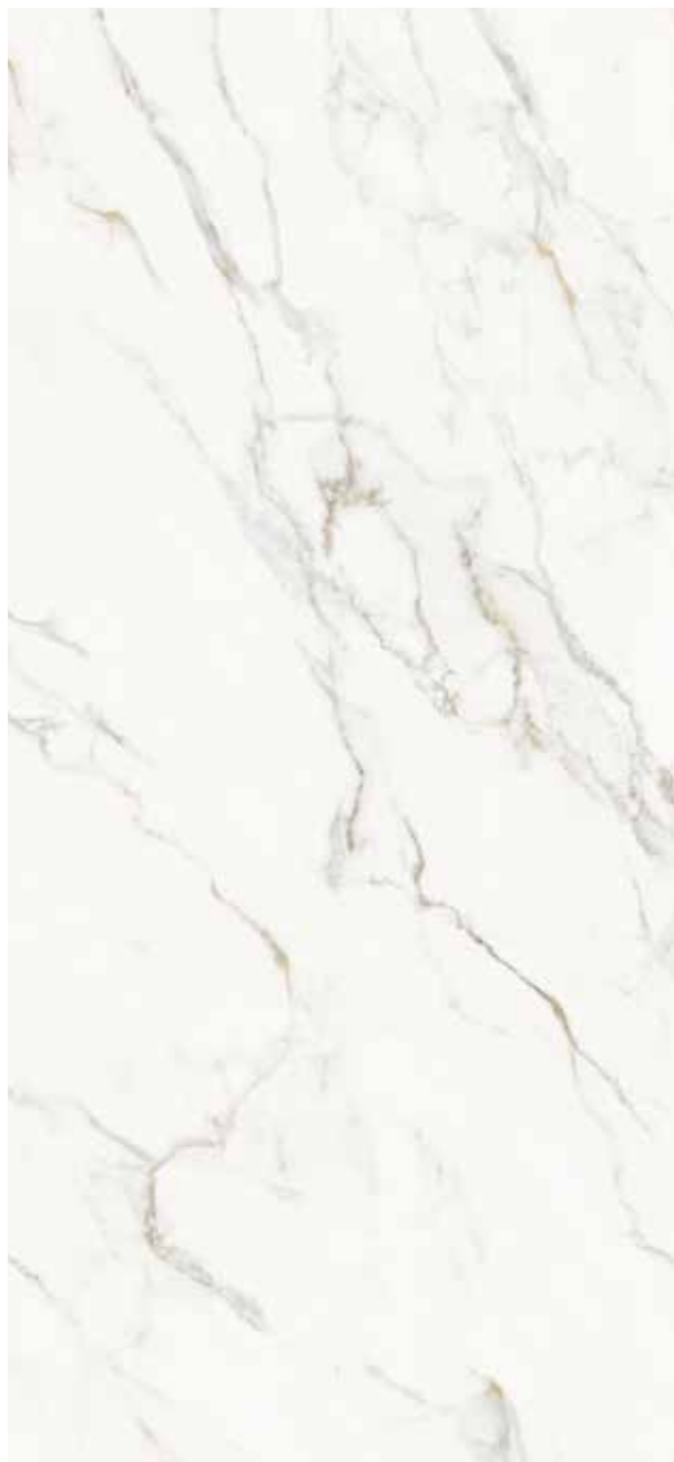
MARMORINO ORO POLER